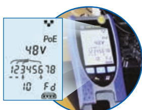
Détection de service