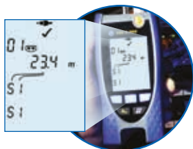
Test câblage coaxial