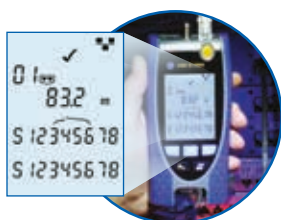
Schéma de câblage et longueur par paire